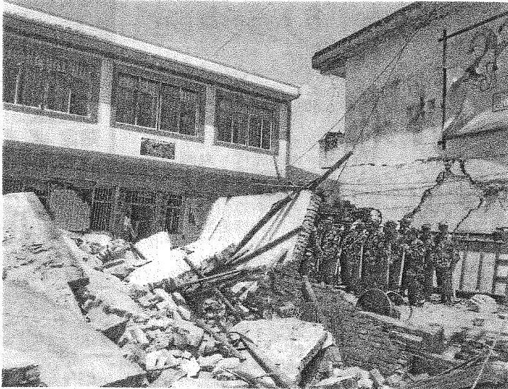
▲ 20日、四川省雅安市蘆山県で地震により倒壊した建物